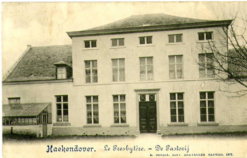
Prent: Hagelands Historisch Documentatiecentrum

De voor- en achtergevel zijn identiek. De gevel is zeer symmetrisch opgebouwd, met centraal de inkomdeur, die in de voorgevel in de 20 ste eeuw vervangen werd. In de achtergevel staat nog de oorspronkelijke dubbele paneeldeur met bovenlicht. Er is een voortuin en een grote achtertuin met speelplein. De pastorie is grotendeels ommuurd.